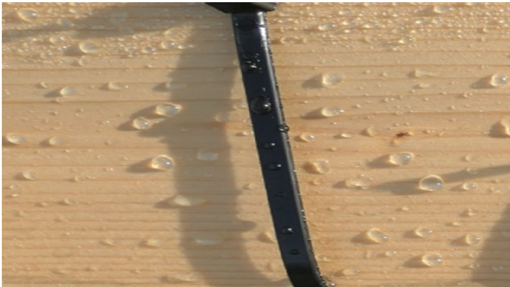
Skandináv lucfenyő / 2 hét a kertben